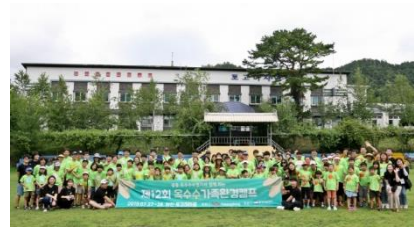
<2019년 진행장소: 화천 토고미마을>