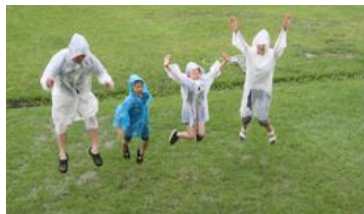
<초록보물 찾기 가족미션>