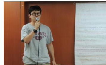
<생태정책 제안서 발표>