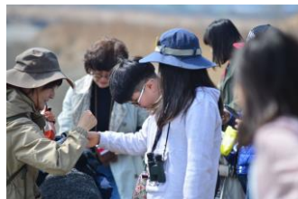
<DMZ 생물종 관찰 활동>