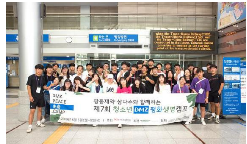
<2019 제7회 DMZ평화생명캠프 >